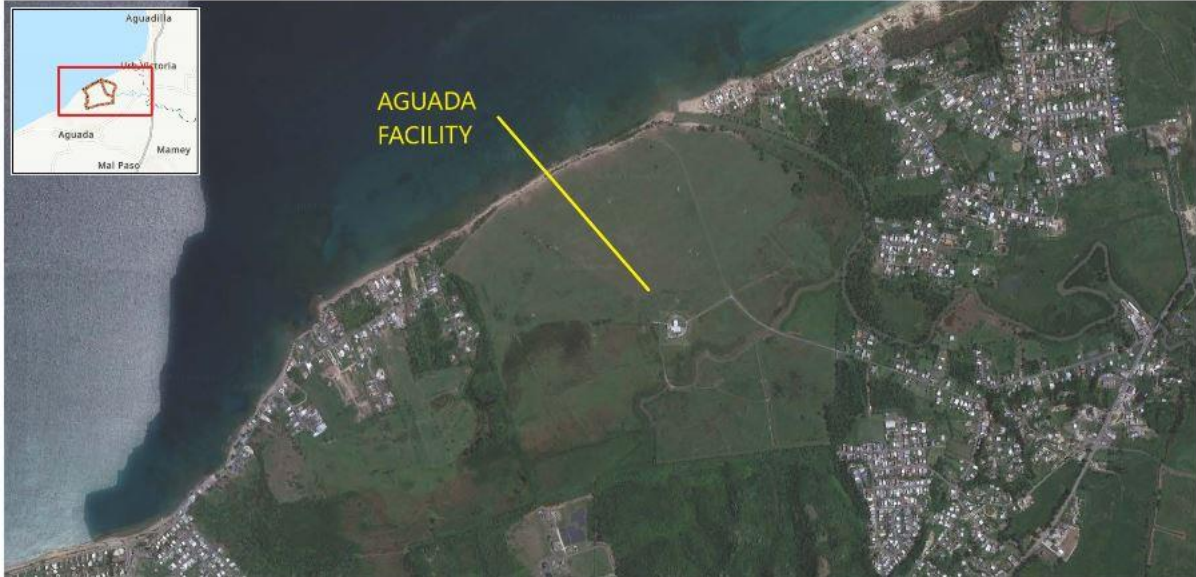
LOCATION MAP: Aguada Facility