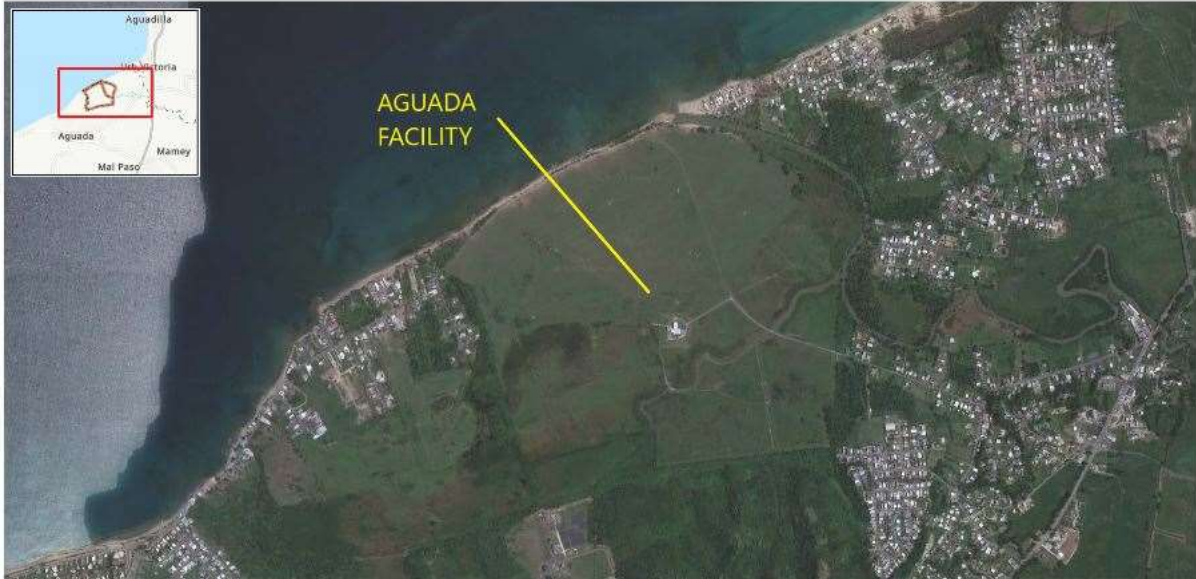
Mapa de Localización: Facilidat de Aguada